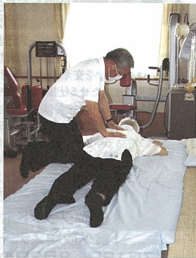
手技による施術でリラックス

している。求人がある際は採用への道も開いている」といい、質の高い人材の確保に役立っている。 同生協の基本理念は、①高齢者の自立と豊かな社会生活を考えながら、衣・食・住などの生活全般と介護を効率良く提供します②地域に密着した県民の相互扶助組織として、介護をめぐる諸問題の解決を図ります③住み慣れた地域や家庭で、安心して快適な老後を過ごすことができるよう、介護を必要とする人たちとその家族を支援します④の三つ。「近本理事長