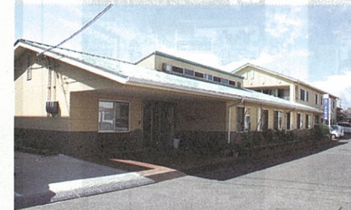
デイサービスセンター「シルバーの家」

の理念を現場で実現するため、最大限の努力を払いたい」と力を込める。 手狭になった施設もあることから、施設拡充を含めた介護事業の新たな展開を思い描く。「利用者の声と新たな介護保険制度の行方を見定めながら考えたい」と締めくくった。